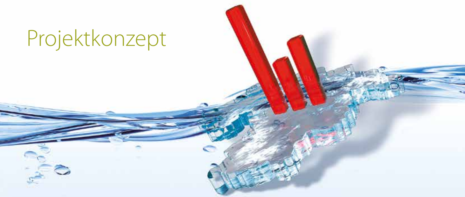
Abb.: Das Fünf-Säulen-Modell

Kennzahlenvergleiche in der Wasserversorgung sind anerkannte Instrumente zur Identifizierung von Potenzialen und damit zur Modernisierung und Stärkung der Wettbewerbsfähigkeit von Wasserversorgungsunternehmen.