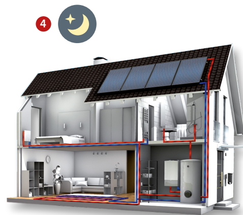
mit zusätzlicher Heizungsunterstützung