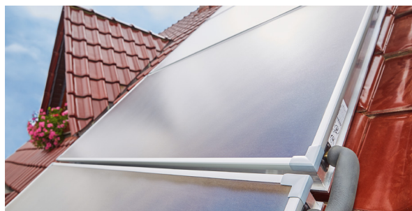
Flachkollektor, Foto: BDEW/Swen Gottschall