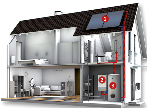
mit solarer Warmwasserbereitung