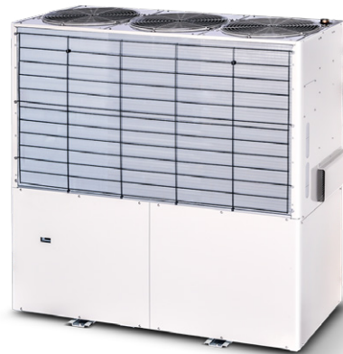
Gasmotorwärmepumpe mit RLT-Kit