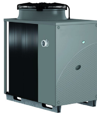
Gas-Absorptions- wärmepumpe, Foto: Remeha GmbH