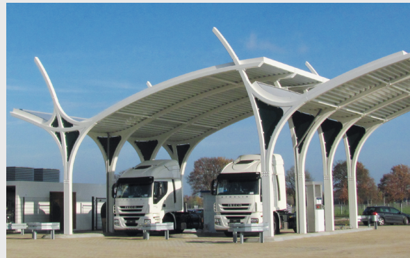
LNG-Tankstelle für Lkws